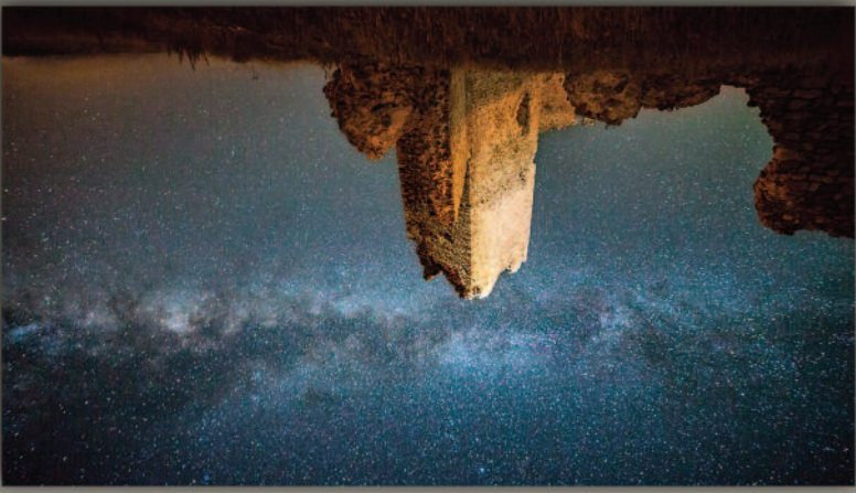
"Vía Láctea en La Torresaviñán"